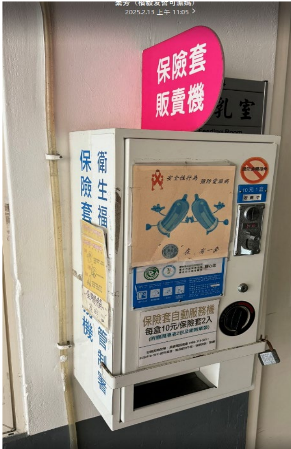
【保險套販賣機提供便利購買管道】