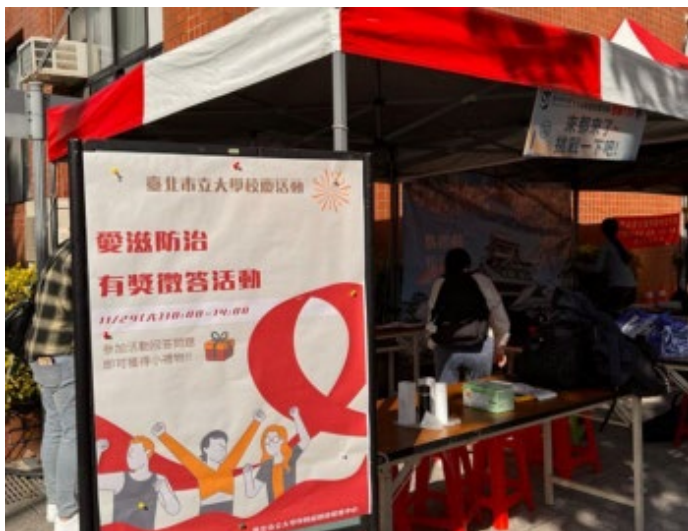
【世界愛滋日活動—校慶擺攤宣導】