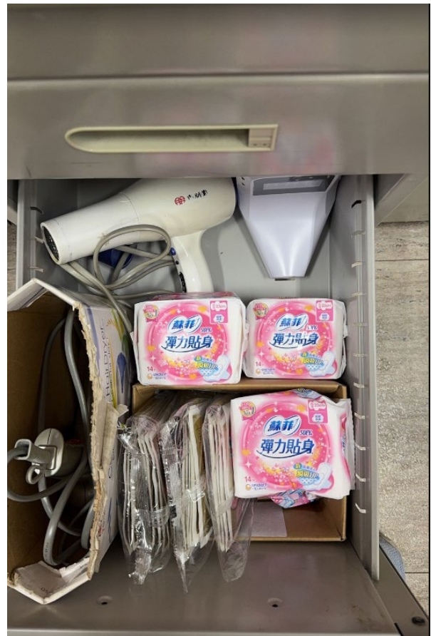
【免費提供衛生棉給有需求的學生】