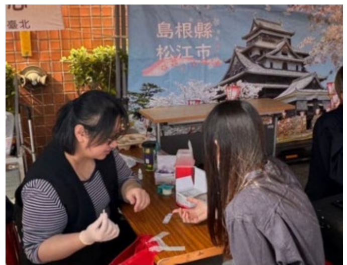
【世界愛滋日活動—愛滋匿名篩檢活動】